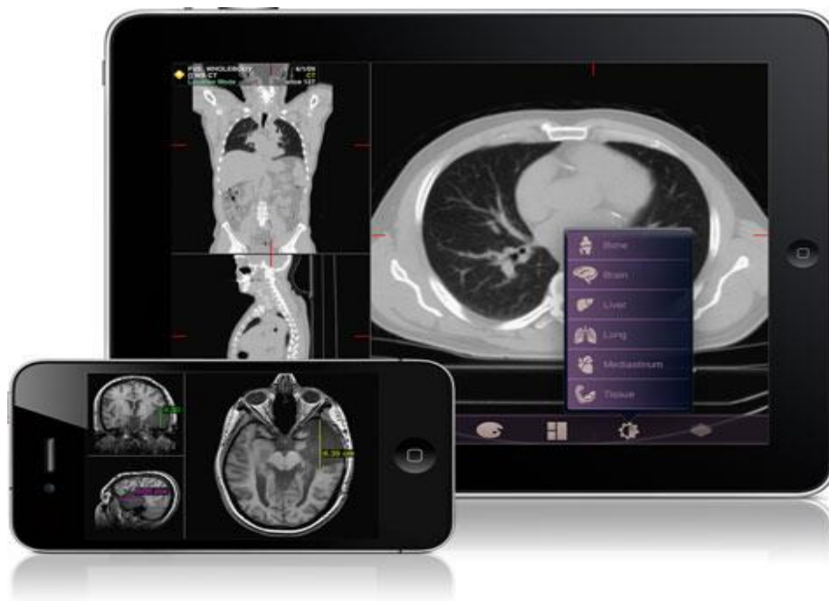
Slika 2. Prikaz radioloških slika preko mobitela i tableta.

Najveća je prednost ujedno i nedostatak, jedan WADO zahtjev vraća jednu DICOM sliku unutar kratkog vremenskog roka (1-10 sekundi), ali za bilo koju promjenu na slici na primjer širina i razine prozora, mora se napraviti novi WADO zahtjev prema poslužitelju, što zapravo onemogućava interaktivnost rada. WADO zahtjeva URL ( engl. uniform resource locator ), svaki dokument ima jedinstvenu URL kojom pristupamo odabranoj stranici. Bilo koji klijent može zatražiti DICOM objekte, kao što su slike, medicinska izvješća, čak iz udaljenih područja. Jednostavni pristup je ostvaren uporabom jedinstvene identifikacije. Namijenjen je za distribuciju slika i nalaza, a na ovaj način slike postaju dostupne na mobitelima, tabletima, osobnom računalu (slika 2.).