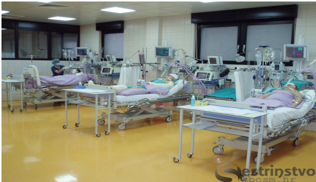
Slika 3. Soba za poslijeanesteziološku skrb