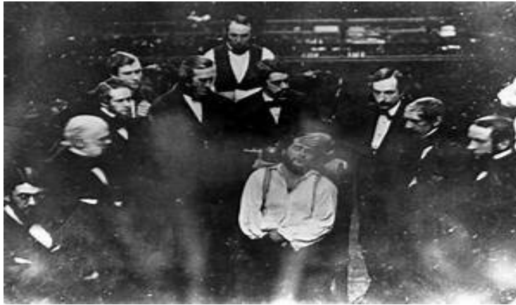
Slika 1. Prva javna demonstracija eterske anestezije u Bostonu 1846.