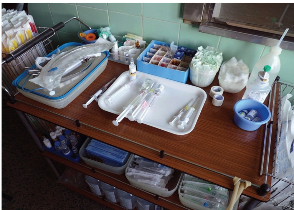
Slika 5. Anesteziološki stolić u operacijskoj dvorani (1)

Anesteziološki stolić dio je opreme kojim se anesteziološki tim koristi u operacijskoj dvorani, a sadrži lijekove, infuzijske otopine, pribor za uspostavljanje dišnog puta, pribor za uspostavljanje intravenskog puta i primjenu intravenskih lijekova, aspiracijske katetere, želučane sonde i ostali potrošni materijal, posebice materijal potreban za rad u aseptičnim uvjetima (kape, maske, sterilne rukavice i dezinficijense ubodnog mjesta) (slika 5). Anesteziološka medicinska sestra/tehničar priprema sve lijekove neposredno prije upotrebe, slaže ih po dogovorenom rasporedu, označava s nazivom lijeka i količinom u miligramu/mililitru. Medicinska sestra/tehničar priprema setove za anesteziju, koji mogu biti gotovi tvornički setovi (najčešće za regionalnu anesteziju) i bolnički pripremljeni setovi, koji se steriliziraju u centralnom odjelu za sterilizaciju nakon pripreme od strane medicinske sestre. Ispravnost sterilizacije (indikator sterilizacije), datum sterilizacije te sadržaj seta kontroliraju specijalista anesteziologije, reanimatologije i intenzivnog liječenja i anesteziološka medicinska sestra/tehničar (1).