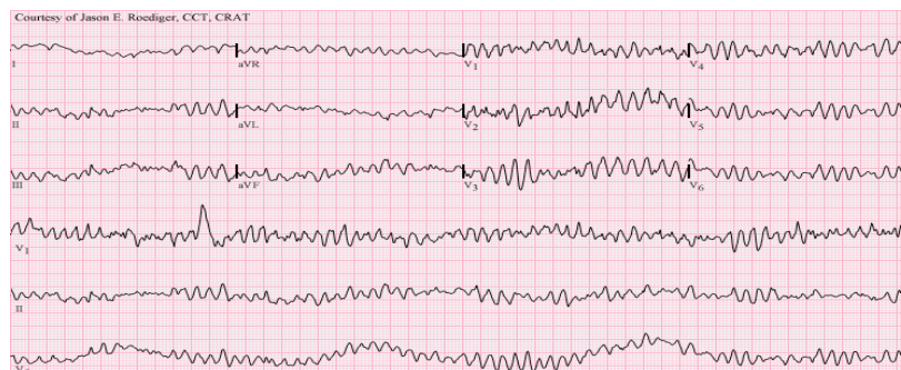
Slika 6. Ventrikularna fibrilacija (3)

Kod odraslih bolesnika, najčešći uzrok gubitka svijesti i potrebe za reanimacijom je srčani zastoj i to u gotovo 80% slučajeva fibrilacija klijetki (FV) (slika 6) (6).