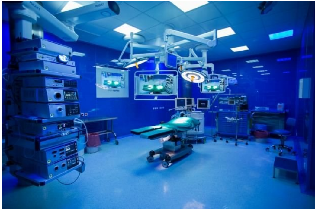
Slika 2. Operacijska dvorana