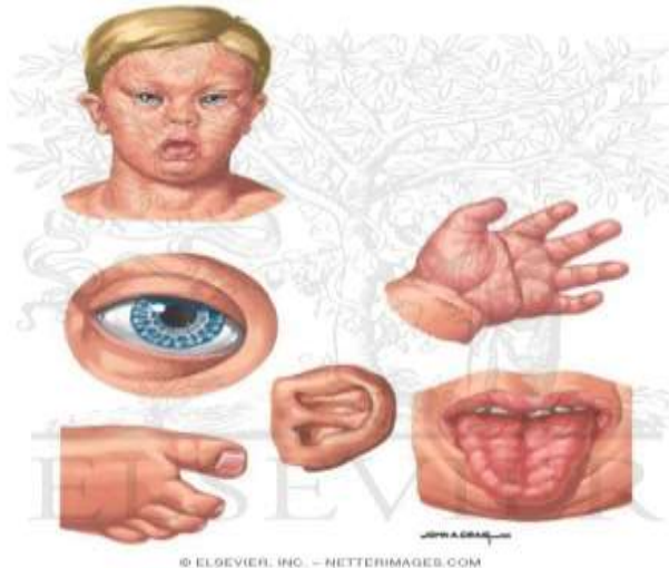
Slika 1. Karakteristična obilježja osobe sa sindromom Down.