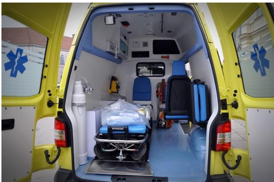
Slika 1: Kola hitne pomoći

mogućnošću brzog zbrinjavanja mogućih komplikacija nastalih tijekom transporta. Za razliku od unutarbolničkog transporta, međubolnički transport je mnogo složeniji. Odvija se u nekontroliranim izvanbolničkim uvjetima bez brzog pristupa bolnici, a obilježen je dužinom prijevoza, vremenskim uvjetima itd. Transport bolesnika iz jedne bolnice u drugu može biti učinjen raznim prijevoznim sredstvima: avionom, helikopterom, sanitetskim vozilom, brodom. Izbor ovisi o kliničkim potrebama, dostupnosti prijevoznog sredstva, vremenskim prilikama, te o uvjetima na mjestu odlaska i dolaska bolesnika (4). Osnovne mjere stabilizacije prije transporta, neophodne medicinsko-tehničke procedure koje treba obaviti prije i tijekom transporta jednake su za sve spomenute vrste prijevoza. Postavljanje pravilnih indikacija za transport, kontinuirana edukacija i dobra opremljenost transportnog tima, čine prijevoz bolesnika značajnim segmentom djelatnosti jedne ustanove (1). Za efikasno funkcioniranje transporta potrebne su jasne smjernice i standardi u pogledu i opreme i kadrova. U protivnom medicinskom timu se nameće dodatna odgovornost u radu (5).