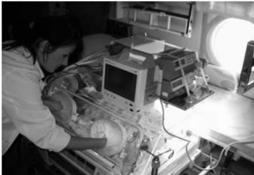
Slika 7. Nadzor novorođenčeta tijekom prijevoza helikopterom

Medicinski transportni tim čine liječnik neonatolog i medicinska sestra koji imaju odgovarajuće znanje i vještine za izvođenje svih postupaka koji su potrebni ili mogu biti potrebni za zbrinjavanje bolesnika. Medicinska sestra odgovorna je za primjenu ordinirane terapije, asistira liječniku prilikom provođenja medicinskih postupaka te provodi zdravstvenu njegu tijekom cijelog transporta.