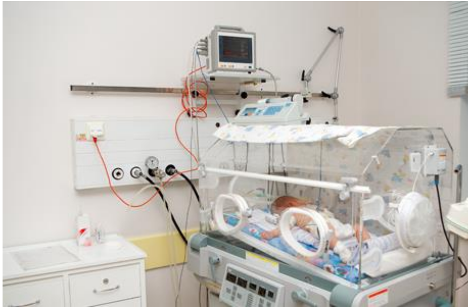
Slika 3. Inkubator i monitoring