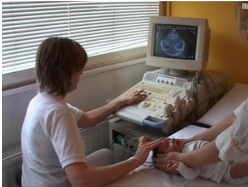
Slika 4. Aparat za UZV mozga

Kod svakog zaprimljenog djeteta radi se UZV mozga pri kojem se može dijagnosticirati intrakranijalno krvarenje te hipoksične promjene na mozgu.