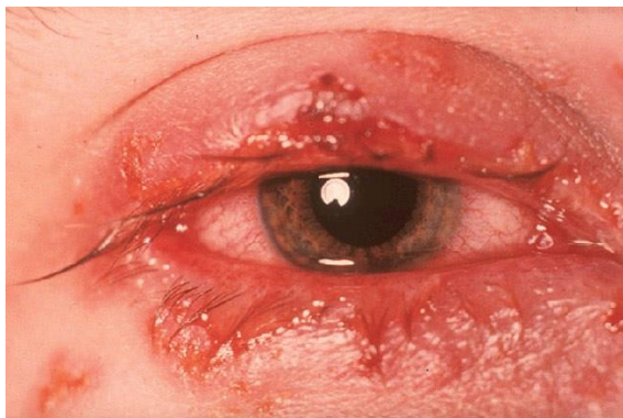
Slika 10. Herpes simpleks keratitis

Herpes može nastati i na drugim lokalizacijama poput uški, obrazima, vratu. Iako je infekcija virusom herpes simplex tip 1 relativno bezazlena, komplikacije nastaju ako se bolest proširi na druge dijelove tijela, a posebno je opasan prijelaz na oči gdje virus može uzrokovati infekciju oka, uz vjeđe, spojnicu i rožnicu i tako dovesti do oštećenja rožnice - herpes simpleks keratitis (Slika 10) (3).