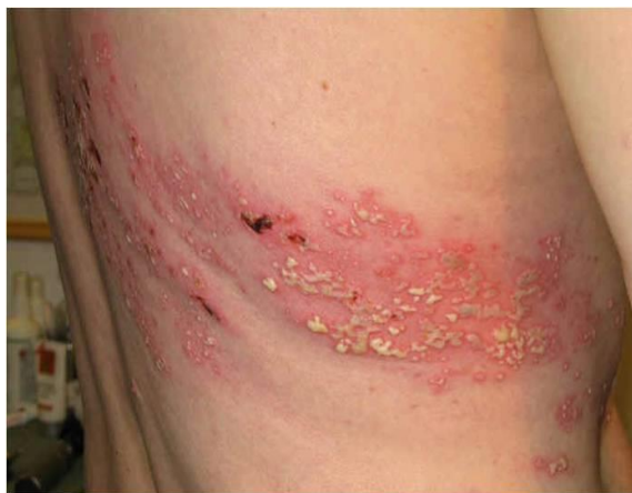
Slika 13. Herpes zoster

Manje od 4% bolesnika ima recidiv herpes zoster. Ipak, mnogi, pogotovo stariji, imaju trajne ili ponavljajuće bolove zahvaćenog dermatoma (postherpetična neuralgija), koji mogu perzistirati mjesecima, godinama ili doživotno. Kod zahvaćenosti trigeminalnog živca često zaostaje jaka i trajna bol (Slika 13) (3).