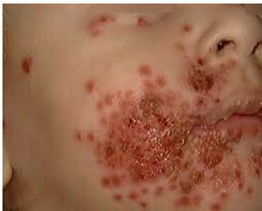
Slika 11. Herpetični ekcem