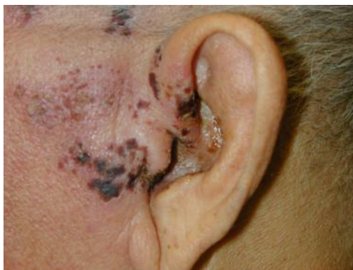
Slika 16. Ramsay-Huntov sindrom