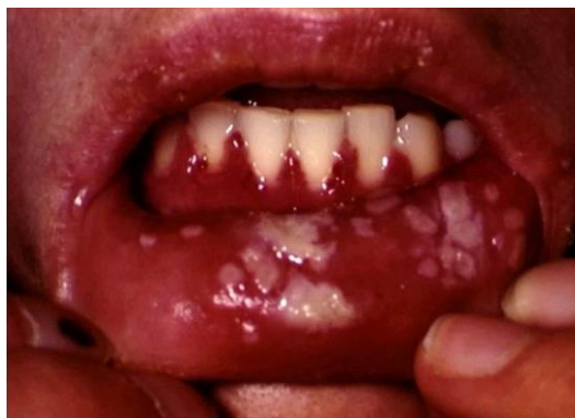
Slika 4. Gingivostomatitis herpetica

Većina oboljelih su djeca kod kojih nakon inkubacije od 2 do 7 dana nastaju bolne aftoidne promjene na sluznici usne šupljine uz opće simptome ( slabost, povraćanje, proljev, vrućica). Na edematoznoj sluznici se nalaze plitke erozije ili ulceracije okružene eritematoznim rubom a promjene se mogu proširiti i na perioralnu regiju. Često je uz bukalnu sluznicu zahvaćen i jezik. Pojačana je salivacija. Djeca odbijaju hranu i piće. Tuže se na bol i pečenje u ustima. Limfni čvorovi na vratu su povećani i bolno osjetljivi. Aftoidne promjene obično se povlače bez komplikacija nakon 7-14 dana, a vrlo rijetko nastaje herpetični meningoencefalitis (Slika 4) (1).