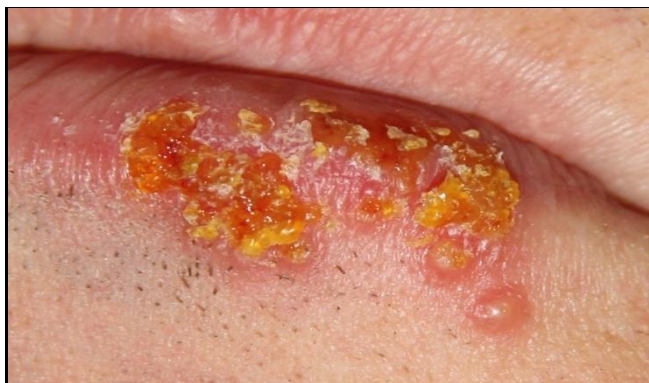
Slika 3. Herpes simpleks

Nakon nekoliko dana mjehuri se počinju sušiti tvoreći tanku žućkastu krastu i plitke vrijedove (Slika 3) (4).