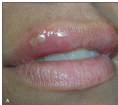
Slika 1. Herpes simpleks

Prije izbijanja herpes simpleksa javljaju se trnjenje, peckanje, nelagoda i svrbež što prethodi mjehurima nekoliko sati pa 2 do 3 dana. Mjehuri okruženi crvenkastim rubom mogu se pojaviti bilo gdje na koži ili sluznicama, ali najčešće u ustima i oko ustiju, na usnama i na spolnim organima (Slika 1) (4).