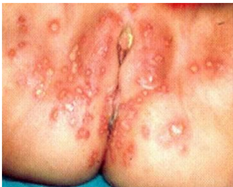
Slika 5. Vulvovaginitis herpetica

U dojenčadi, a rjeđe u veće djece, infekcija se može širiti krvlju i zahvatiti unutarnje organe uključujući mozak—infekcija koja može dovesti do smrti (Slika 5) (1).