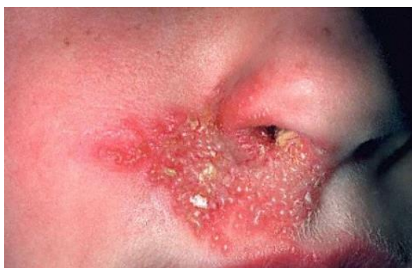
Slika 9. Herpes simpleks nasalis