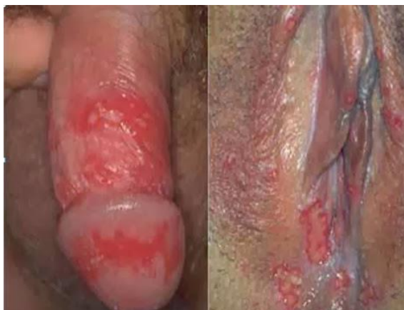
Slika 12. Genitalni herpes kod muškarca (lijevo) i žene (desno)