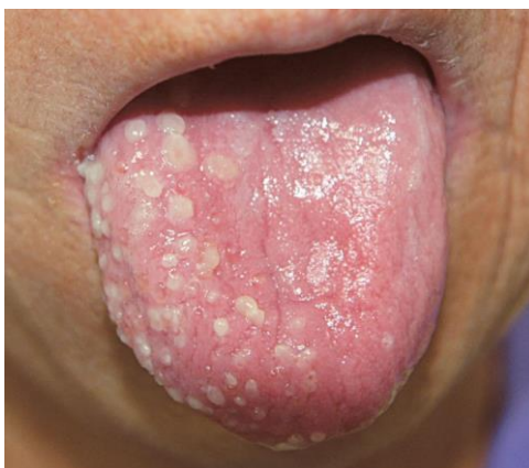
Slika 15. Oralni herpes zoster

Mandibularni zoster/zoster usne šupljine je rijedak. Zahvaćene su druga i treća grana n.trigeminusa. Mogu se pojaviti grupirane eritematozne erozije u usnoj šupljini, u predjelu tvrdog nepca i gornje čeljusti (druga grana ) ili jezika i donje čeljusti (treća grana ) (Slika 15) (1).