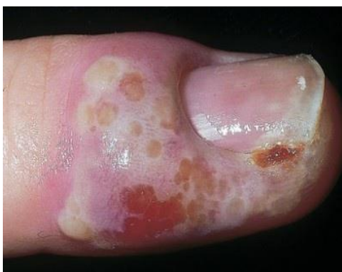
Slika 7. Herpetička paronihija

Otečene, bolne i eritematozne promjene na distalnim falangama prstiju posljedica su inokulacije HSV-a kroz kožu i uglavnom se susreće u zdravstvenih djelatnika (Slika 7) (1).