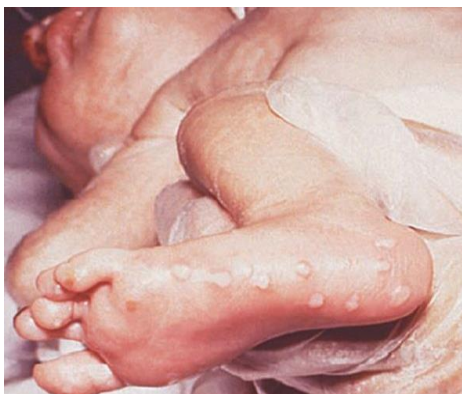
Slika 6. Herpes simpleks neonatorum