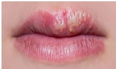
Slika 2. Herpes simpleks

Mjehuri se najčešće oblikuju u grozdove koji se udružuju u velika pojedinačna žarišta. Veličina nakupina može biti od 0,5 do 1,5 cm, a mogu se spajati. Promjene na nosu, ušima, očima, prstima ili genitalijama mogu biti izrazito bolne (Slika 2) (4).