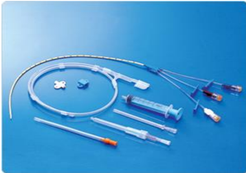
Slika 1. Prikaz seta za postavljanje SVK

Sestra dodaje liječniku : • sterilnu kompresu • sterilnu iglu i špricu u koju se navlači lokalni anestetik (lidokain) • set za SVK • sterilne šprice od 10 ml koje se ispune sterilnom 0,9%NaCl (15).