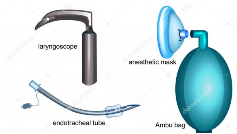
Slika 6. Pribor za anesteziranje (trahealni tubus, maska, laringoskop, Ambu balon)

Anesteziolog mora imati trajnu mogućnost praćenja pacijenta i očitavanje vrijednosti parametara na zaslonu monitora. Također, vrata dvorane se ne zatvaraju kako bi se čuli akustički signali anesteziološkog uređaja. Ukoliko dođe do poremećaja anestezioloških pokazatelja ili do pogoršanja stanja pacijenta radiološki postupak se može prekinuti. Ukoliko anesteziolog želi trajno boraviti uz pacijenta potrebno ga je odgovarajuće zaštititi zaštitnom pregačom, naočalama i ovratnikom, prozirnim pomičnim štitnikom i ostalim zaštitnim sredstvima (1).