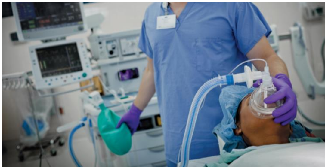
Slika 3. Primjena inhalacijskog anestetika