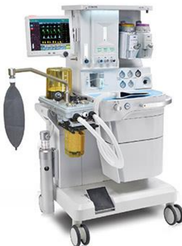
Slika 5. Aparat za anesteziju

Vrlo je bitno prije samog uvoda u anesteziju dobro namjestiti sve potrebne dijelove anesteziološkog uređaja, staviti kanilu u venu te postaviti infuziomat i sustav za protok tekućina. Treba pripaziti da anesteziološki uređaj ne smeta pri pomicanju rendgenskog uređaja (Slika 5).