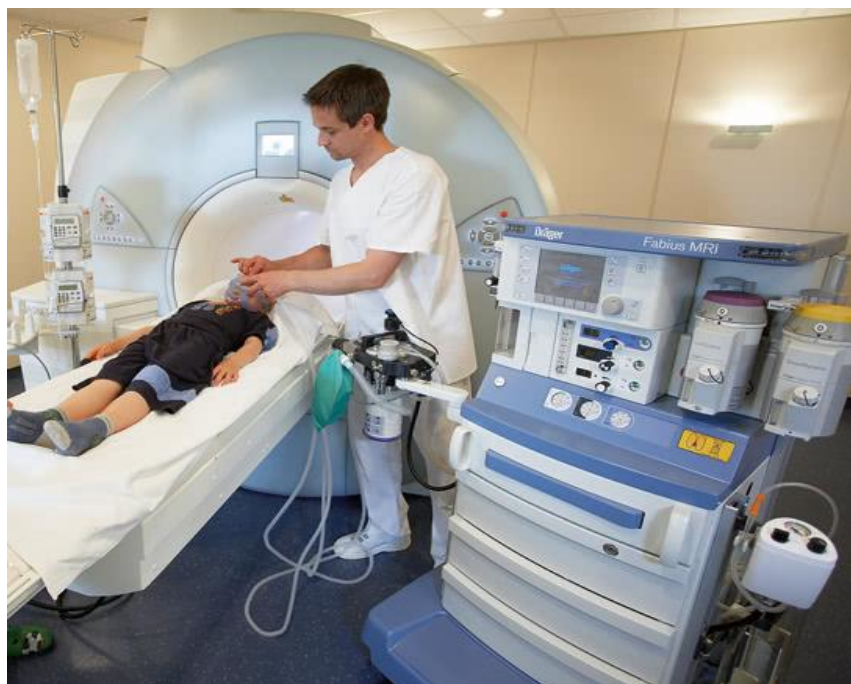
Slika 9. Anestezija djeteta pri MR pretrazi

Održavanje anestezije tijekom snimanja se može vršiti raditi intravenskim ili inhalacijskim putem. Standardne infuzijske pumpe jako su feromagnetične i one mogu biti opasne ukoliko postanu projektili. Također, unutar MR polja mogu prestati normalno raditi. Uređaji za anesteziju i ventiliranje koji su MR kompatibilni mogu biti smješteni uz sam magnet (Slika 9). Upravo zahvaljujući toj činjenici smanjuje se duljina sustava za disanje te nam je osigurano sigurno davanje hlapljivih anestetika pacijentu (16).