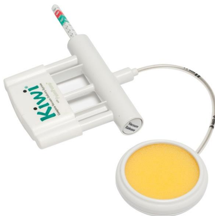
Slika 3. Kiwi vakuum sistem za pomoć pri porodu. Izvor [Internet]. Dostupno na: https://www.google.hr/search?q=kiwi+vakum&hl=hr&dcr=0&source=lnms&tbn=isch&sa=X&ved=0ahUKEwi3md6T8NvcAhWlzIUKHRZuDpEQ_AUICigB&biw=1366&bih=631#imgrc=9mDCHIWUbeIMqM:

Škotski profesor primaljstva James Simpson uveo je u praksu 1849. godine prvi klinički uporabljivi vakuumski ekstraktor. Bio je to metalni instrument zvonolikog oblika, pokriven kožom na cefalopelvičnom kraju. Mekani vakuum uveden je 1973. godine. Od tada se pojavljuju brojne izvedbe mekih, polurigidnih i rigidnih poklopaca izrađenih od različitih materijala (gume, plastike, spužve). U zadnje vrijeme proizvode se i rabe mekani silastični vakuumski ekstraktori s portabilnom ručnom vakuumskom crpkom i centralnim aplikatorom. Najpopularniji takav instrument je vakum Kiwi.