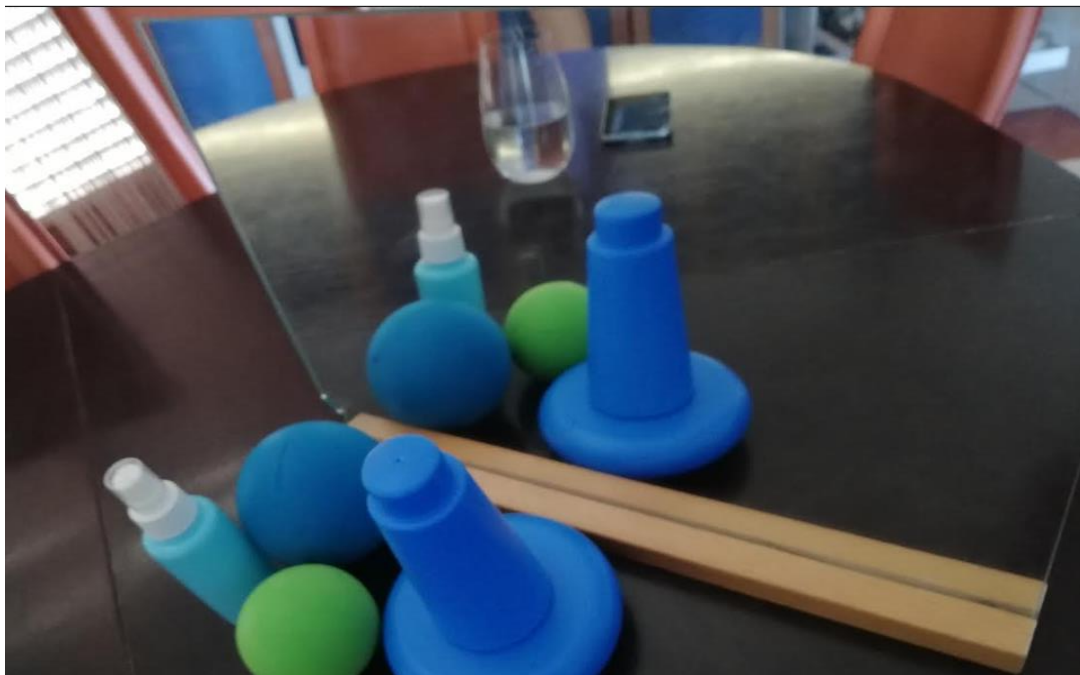
Slika 2. Oprema za izvođenje zrcalne terapije

Smjernice za rehabilitaciju pacijenata nakon moždanog udara navode kako se terapija najčešće provodi po završetku akutnog bolničkog liječenja do 4 mjeseca nakon moždanog udara, kroz 4 do 8 tjedana, 5 dana tjedno, u trajanju od 30 minuta (13).