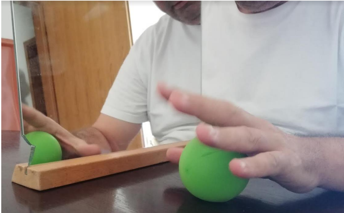
Slika 3. Provođenje terapija