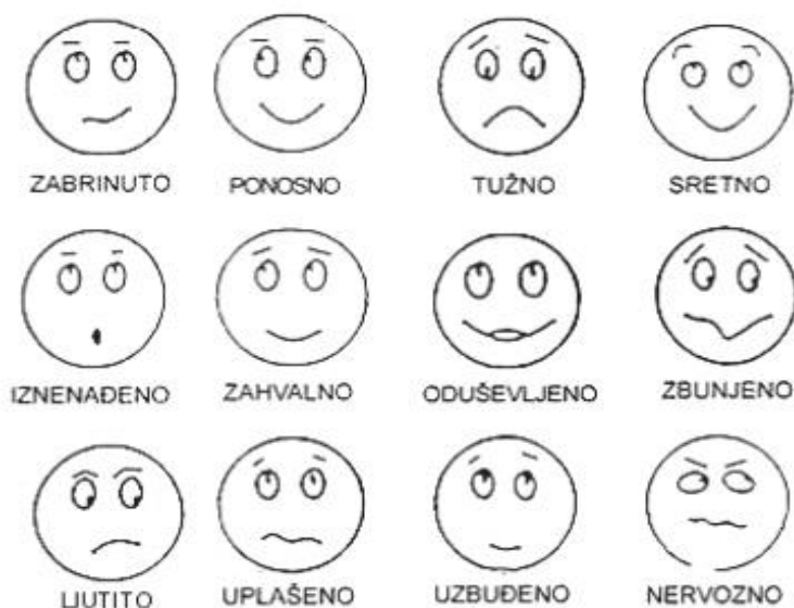
Slika 8. Primjer za učenike trećeg razreda OŠ (2)

Crvenom bojom oboji one likove kojima bi prikazao/prikazala osjećaj izazvan neprihvatljivim dodirima ( nelagodu ).