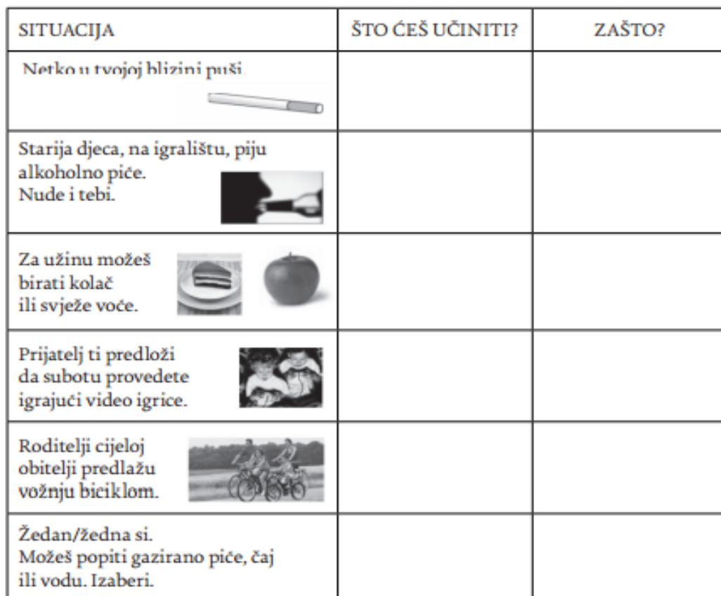
Slika 7. Primjer zadatka za učenike trećeg razreda osnovne škole