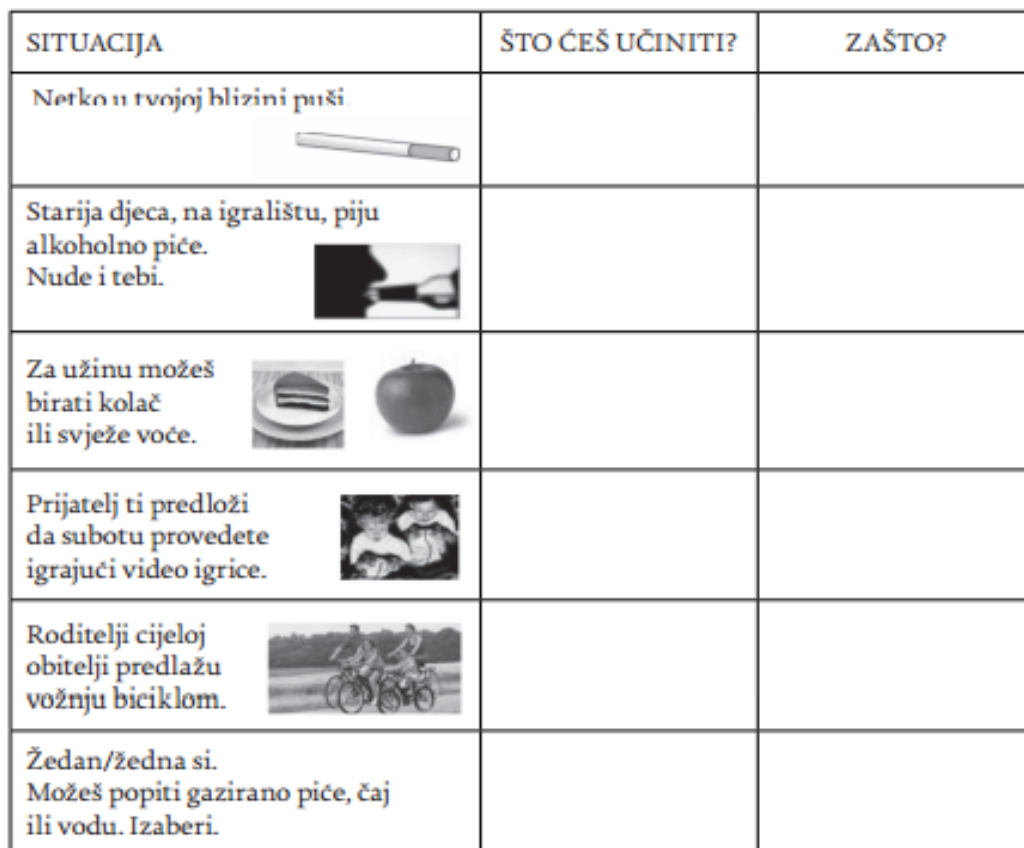
Slika 7. Primjer zadatka za učenike trećeg razreda osnovne škole