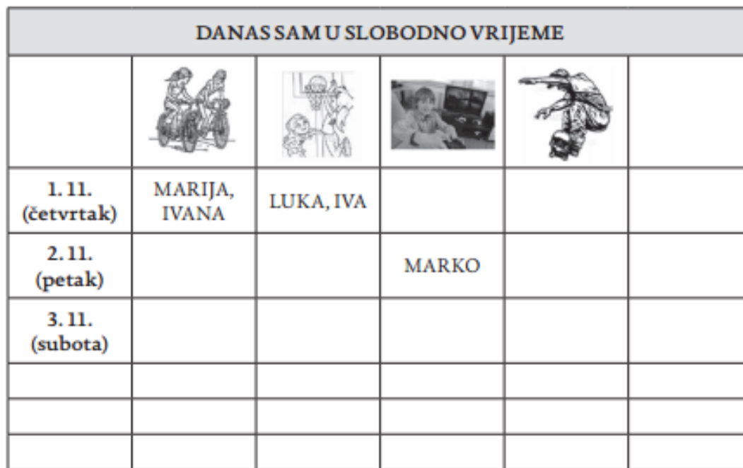
Slika 2. Primjer mjesečnog projekta tjelesne aktivnosti djece u četvrtom razredu osnovne škole (2).