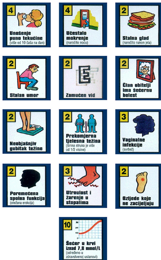
Slika 1. Osnovni simptomi šećerne bolesti

i stanja: hipertenzije, sljepoće, infarkta miokarda, moždanog udara, teškog oštećenja bubrega, gangrene, smanjuje se osjećaj boli a povećava sklonost infekcijama (21).