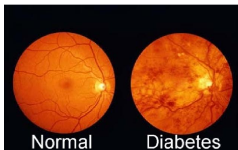
Slika 2. Prikaz normalnog oka i dijabetički oboljelog oka