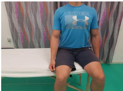
Slika 7. Aktivni pokret addukcije u sjedećem položaju