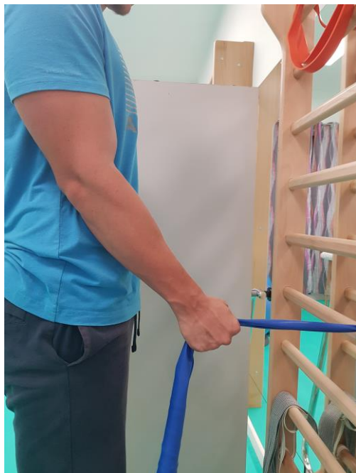
Slika 25. Početni položaj stojeći uz ljestve

4 MJESECA + - intenzivne vježbe jačanja bicepsa, vježbe jačanja mišića podlaktice