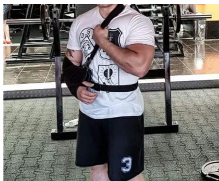
Slika 3. Pacijent s laktom postavljenim u ortozi