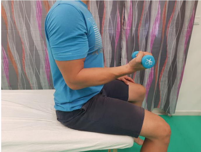
Slika 27. Vježba jačanja m.biceps brachii s bučicom od 1kg