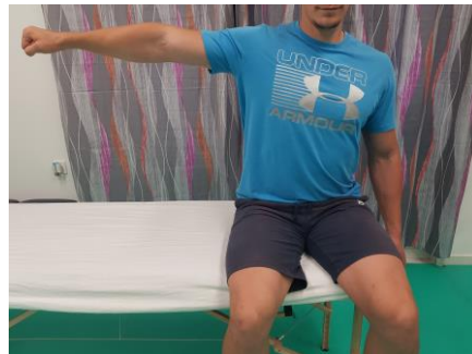
Slika 8. Aktivni pokret abdukcije u sjedećem položaju

3.TJEDAN – ortoza se otključava na 90° (puna fleksija), potpuno pasivne vježbe fleksije (puni opseg), izometričke vježbe jačanja tricepsa, aktivne vježbe šake i ramenog obruča, vježbe cirkulacije; pasivna fleksija, aktivna ekstenzija u zadanom opsegu.