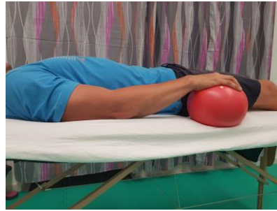
Slika 9.1., Slika 9.2. Izometrička vježba jačanja m.triceps brachii