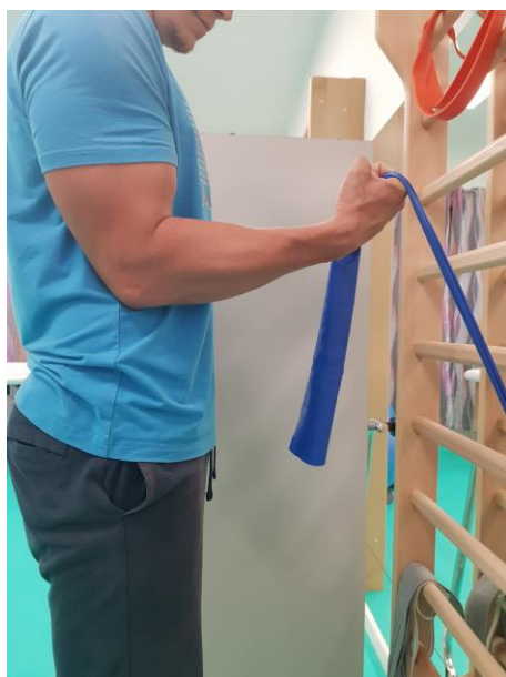
Slika 26. Vježba jačanja m.biceps brachii uz pomoć elastične trake