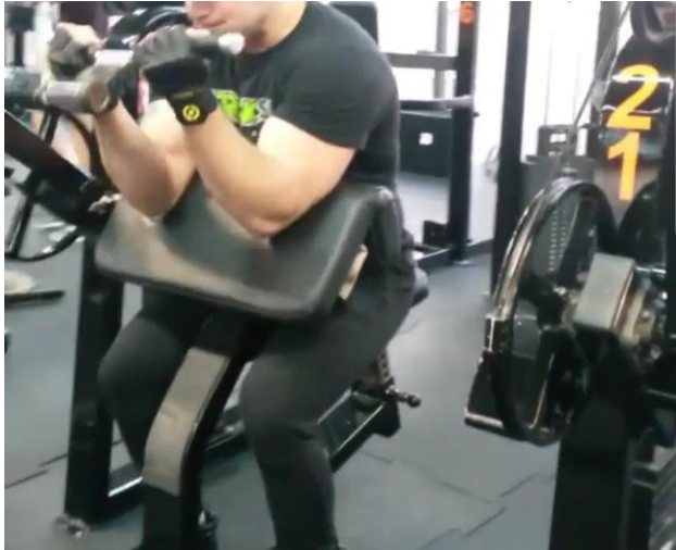
Slika 29. Vježba jačanja m.biceps brachii na Smithovoj klupici