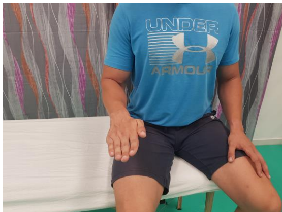
Slika 21. Aktivni pokret pronacije u sjedećem položaju