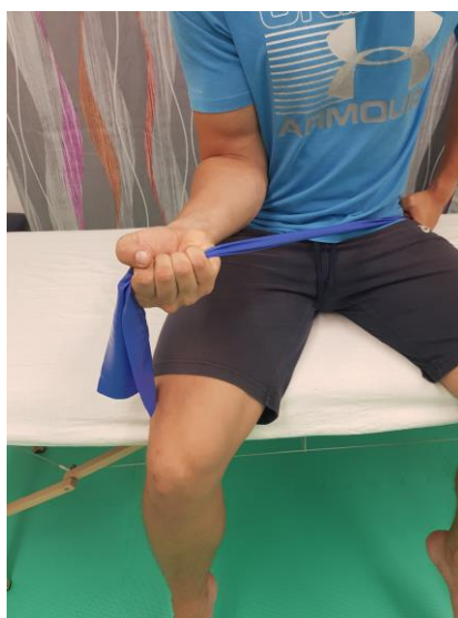
Slika 24. Pokret supinacije s otporom od strane trake