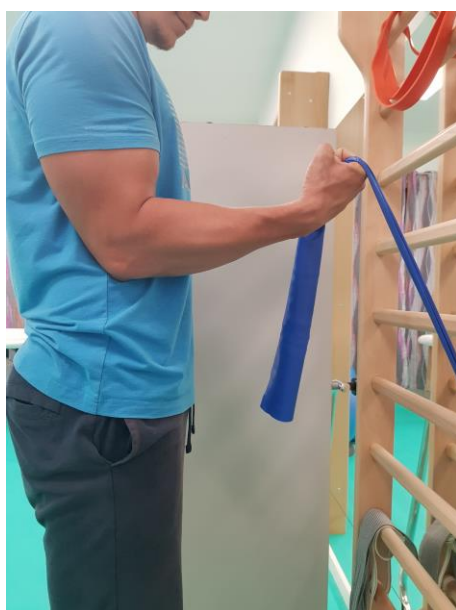
Slika 26. Vježba jačanja m.biceps brachii uz pomoć elastične trake