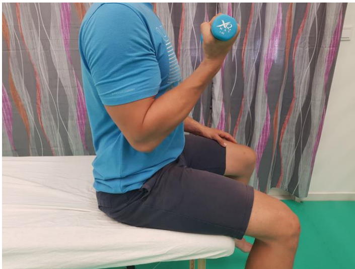
Slika 28. Vježba jačanja m.biceps brachii