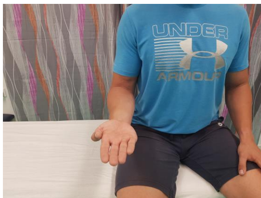
Slika 20. Aktivni pokret supinacije u sjedećem položaju