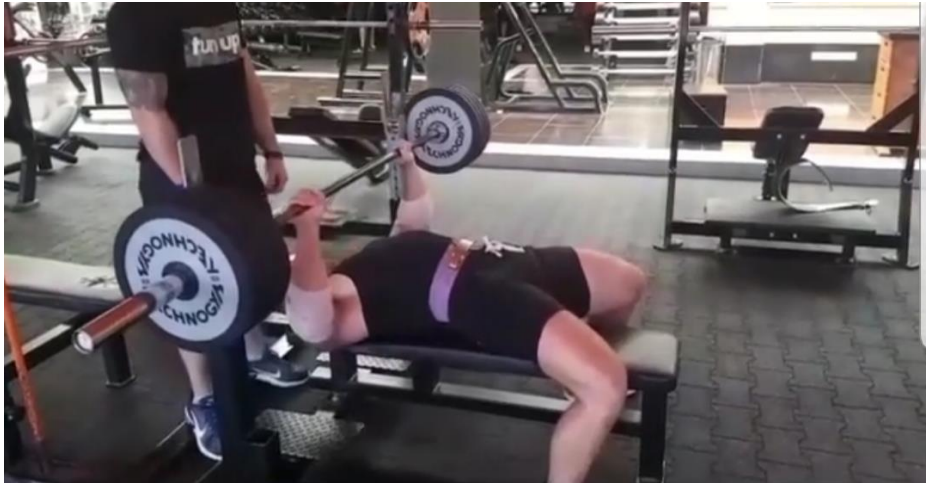
Slika 33. Pacijent pri izvođenju potiska s klupe 7 mjeseci nakon operacije