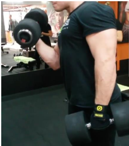
Slika 30. Vježba jačanja m.biceps brachii s utezima