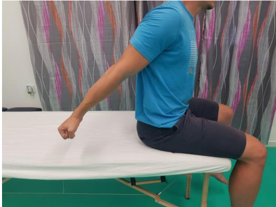
Slika 6. Aktivni pokret retrofleksije u sjedećem položaju