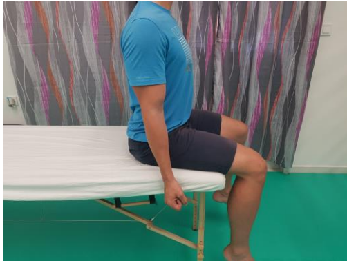
Slika 16. Početni položaj sjedeći