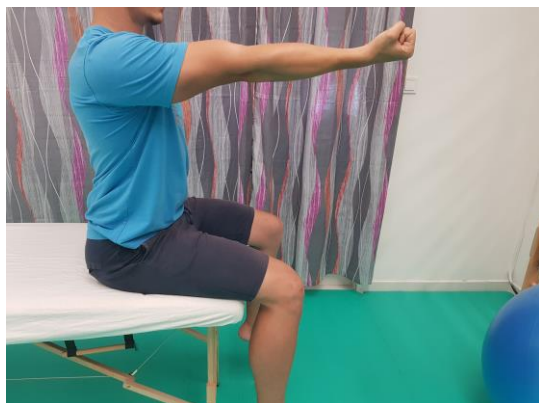
Slika 5. Aktivni pokret antefleksije u sjedećem položaju

Provođene aktivne vježbe ramenog obruča. Vježbe izvodimo u cilju očuvanja gibljivosti u području ramenog obruča, te sprječavanju kontrakture u samom ramenom zglobu. Izvođene su vježbe aktivne antefleksije, retrofleksije abdukcije i addukcije te elevacije. Vježbe su izvođene antigravitacijski u ležećem položaju na leđima i sjedećem položaju.