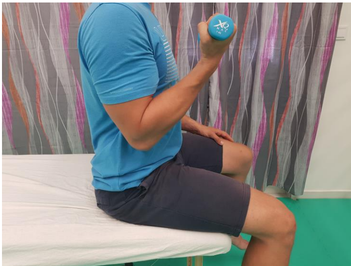
Slika 28. Vježba jačanja m.biceps brachii