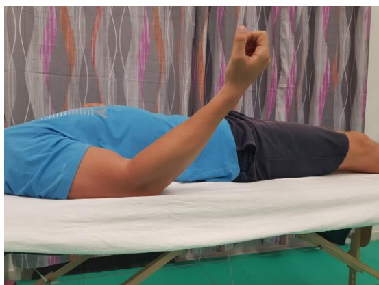
Slika 14. Aktivni pokret fleksije u laktu (70°)