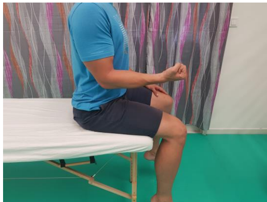
Slika 17. Aktivni pokret fleksije u laktu 90°