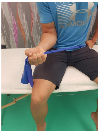
Slika 24. Pokret supinacije s otporom od strane trake