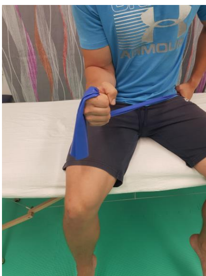
Slika 23. Početni sjedeći položaj sa trakom