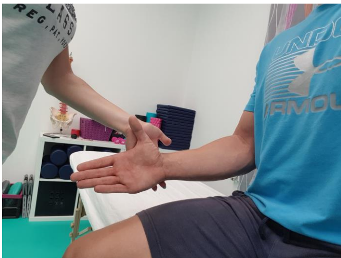
Slika 22. Pokret supinacije protiv otpora ruke terapeuta u sjedećem položaju