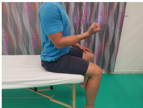
Slika 18. Aktivni pokret fleksije u laktu (100°)