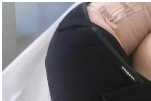
Slika 2. Lakat nakon operacije u ortozi, zavoju

Pacijentu postavljen Mendelov povoj, elastični zavoj, ortoza u položaju lakta od 60°, rani poslijeoperacijski tijek je uredan.