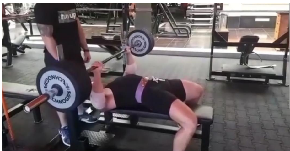
Slika 33. Pacijent pri izvođenju potiska s klupe 7 mjeseci nakon operacije