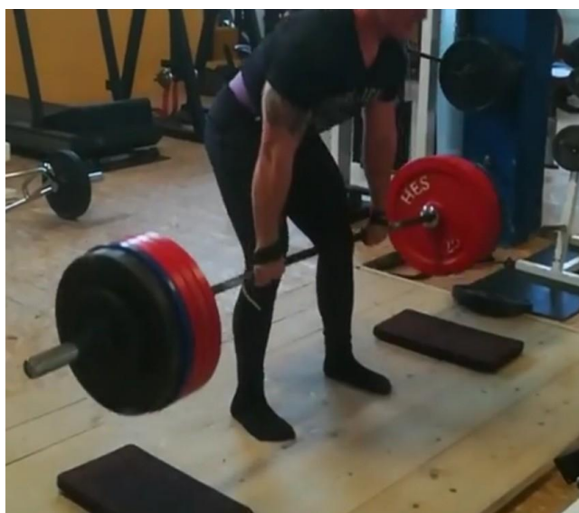
Slika 32. Pacijent prilikom izvođenja mrtvog dizanja 1 godinu nakon operacije