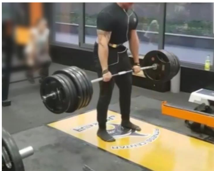
Slika 31. Pacijent prilikom izvođenja mrtvog dizanja 8 mjeseci nakon operacije