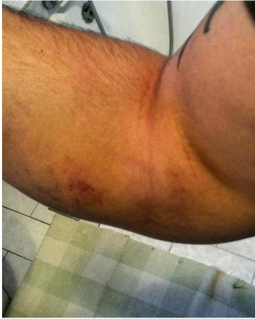
Slika 1. Prikaz ozlijeđenog lakta