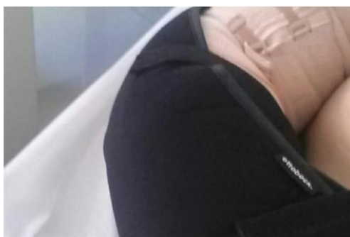
Slika 2. Lakat nakon operacije u ortozi, zavoju

Pacijentu postavljen Mendelov povoj, elastični zavoj, ortoza u položaju lakta od 60°, rani poslijeoperacijski tijek je uredan.