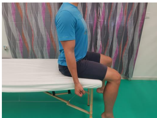
Slika 16. Početni položaj sjedeći