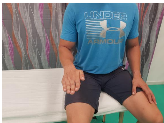
Slika 21. Aktivni pokret pronacije u sjedećem položaju