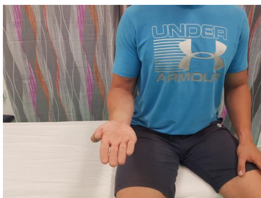
Slika 20. Aktivni pokret supinacije u sjedećem položaju