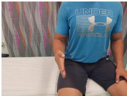
Slika 19. Početni sjedeći položaj za izvođenje supinacije i pronacije