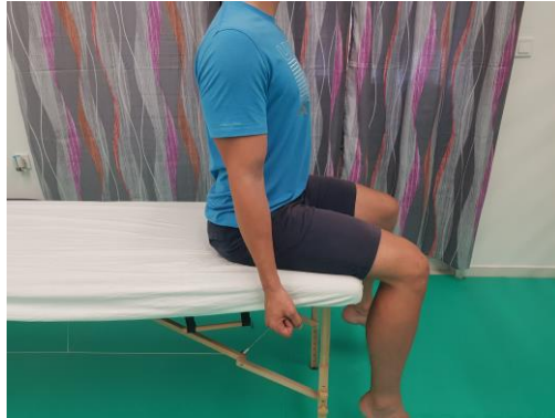
Slika 16. Početni položaj sjedeći