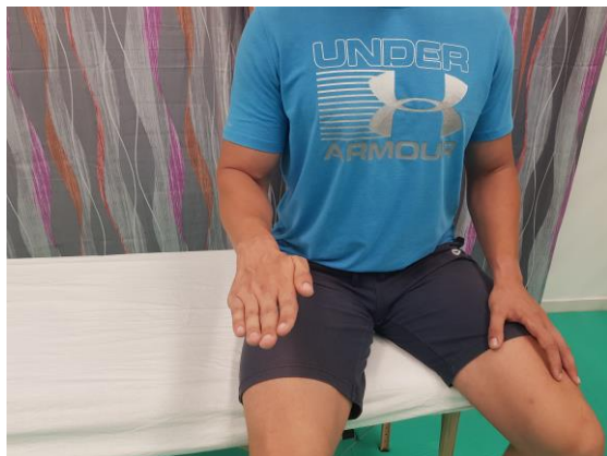
Slika 21. Aktivni pokret pronacije u sjedećem položaju