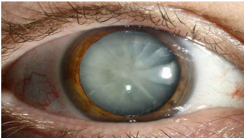
Slika 6. Prikaz katarakte leće oka koja nastaje determinističkim oštećenjem

b) stohastička oštećenja ( nedeterministička oštećenja ) kao što su rak bronha, rak dojke, štitne žlijezde, te solidni karcinomi i leukemije.