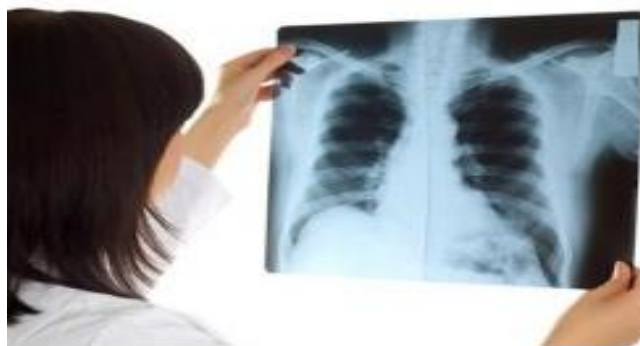
Slika 4. Prikaz rendgenskog filma temeljen na fotografskom učinku ; izvor:

Biološki učinci mogu biti: poželjni (pr. radioterapija tumora, ozračenje cijelog tijela kod liječenja nekih leukemija) i nepoželjni (a to su po organizam sve štetne posljedice koje nastaju pri namjernom ili nenamjernom izlaganju zračenju – oštećenje metaboličkih procesa u stanicama, poremećaj rasta i razmnožavanja, oštećenje nasljedne mase – mutacije, smrt stanice i cijelog organizma).