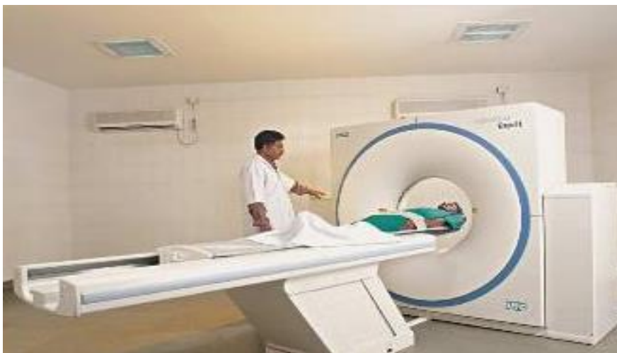
Slika 8. Jedna od glavnih digitalnih metoda u radiologiji – magnetska rezonanca

Prednosti digitalnih metoda su: znatno veći kontrast slike, mogućnosti različitih mjerenja „gustoće“ pojedinih dijelova snimanog objekta, različite rekonstrukcije slike bez dodatnog zračenja bolesnika (nema ionizirajućeg zračenja!) , multiplanarni prikaz, različita volumetrijska mjerenja, arhiviranje slike na magnetni ili optički disk, te digitalnu arhivu, virtualnu endoskopiju, teleradiološku razmjenu elektronskih podataka i radioloških slika.