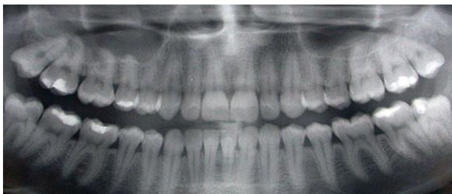
Slika 7. Panoramski prikaz zubiju čovjeka u dentalnoj radiologiji