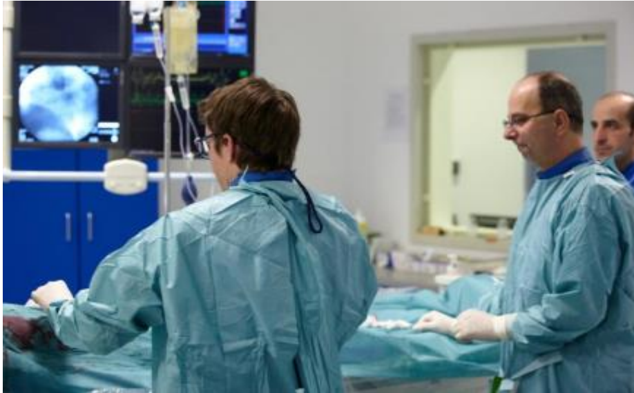
Slika 9. Prikaz operacije u angiografskoj sali gdje su pacijent i profesionalno osoblje izloženi velikim dozama ionizirajućeg zračenja

Nijedna osoba pri snimanjima ili dijaskopiji ne smije biti u smjeru centralne zrake rendgenskog snopa!