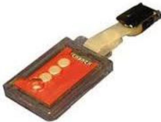
Slika 5. Film dozimetar – najčešća vrsta dozimetra u dijagnostičkoj radiologiji

Treća vrsta su dozimetri tipa ionizacijske komore među kojima je najpoznatiji tzv. Penkala dozimetri ( Quartz Fibre Electrometers, QF Electroscop e) koji omogućava izravno, trenutačno očitavanje kumulativne doze ekspozicije zračenju. Radi na principu ionizirajuće komore, te može detektirati sve vrste zračenja s maksimalnim rasponom od 2 mSv do 10 Sv. Njegova prednost je direktno očitavanje doze, a nedostaci su mu: osjetljivost na mehaničke udare, vibracije i temperature, te osrednja pouzdanost izmjerenih doza zračenja.