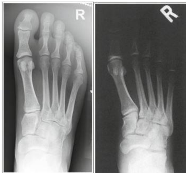
Slika 2. AP projekcija stopala s i bez kompezirajućeg filtra iznad prstiju stopala.

Kod nekih pregleda je ekspozicija namještena da adekvatno prikaže jednu interesnu strukturu zbog čega druge strukture mogu biti preekspozirane. To se pojavljuje zbog razlike u debljini među strukutrama koje snimamo. AP projekcija ramena, stopala i torakalne kralježnice su tri primjera za prikazivanje ovog problema (Slika 2).