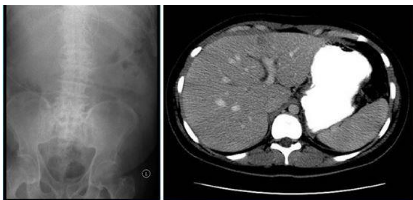
Slika 8. Prikazana je usporedba slike klasičnog RTG uređaja te CT uređaja.