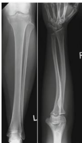
Slika 5. AP projekcija potkoljenice gdje je učinak anode iskorišten ispravno (koljeno pozicionirano na kraju katode) te AP projekcija podlaktice gdje je učinak anode nije korišten ispravno (ručni zglob pozicioniran na kraju katode).