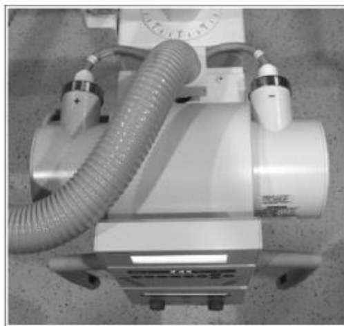
Slika 4. Rendgenska cijeva sa simbolima + za anodu i - za katodu.

postavljajući kraj anode rendgenske cijevi na vrh glave pacijenta. Postavljanje kraja cijevi anode može se razlikovati u napomeni pacijentu kako je i cijev pomaknuta u horizontalni položaj. Za identificiranje kraja anode i katode rendgenske cijevi trebamo locirati + i – simbole prikačene na kućište cijevi gdje ulazi električno napajanje. Simbol + koristi se za prepoznavanje kraja cijevi anode, a simbol – ukazuje na kraj katode (Slika 4).