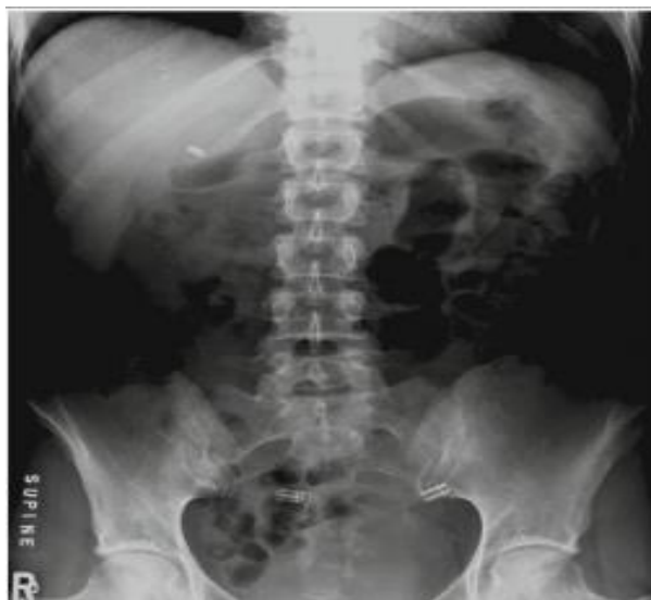
Slika 1. AP projekcija abdomena pri čemu su korištene centralne komore.