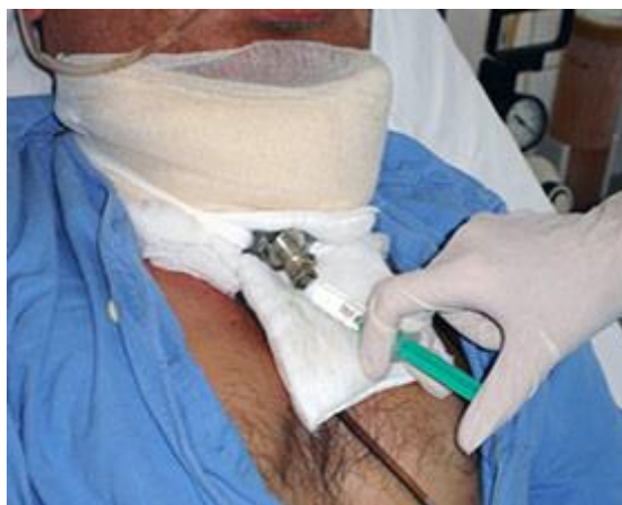
Slika 2. Njega traheostome i trahealne kanile

koordinirani pristup, bolju komunikaciju te aktivnu rehabilitaciju sa ciljem poboljšanja kvalitete života svakog traheotomiranog bolesnika. Pružanjem psihološke podrške i povjerenjem traheotomiranog bolesnika u medicinsku sestru, znatno se povećava bolesnikovo prilagođavanje na postavljenu traheostomu. Daljnja edukacija medicinskih sestara bitna je za učinkovitu kvalitetu usluga zdravstvene njege traheotomiranih bolesnika te povećanja učinkovitosti postupaka zdravstvene njege (12).