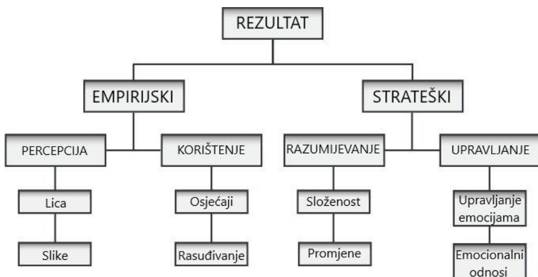
Slika 1. MSCEIT test (18)