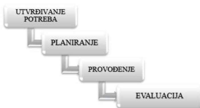
Slika 4. Faze procesa zdravstvene njege