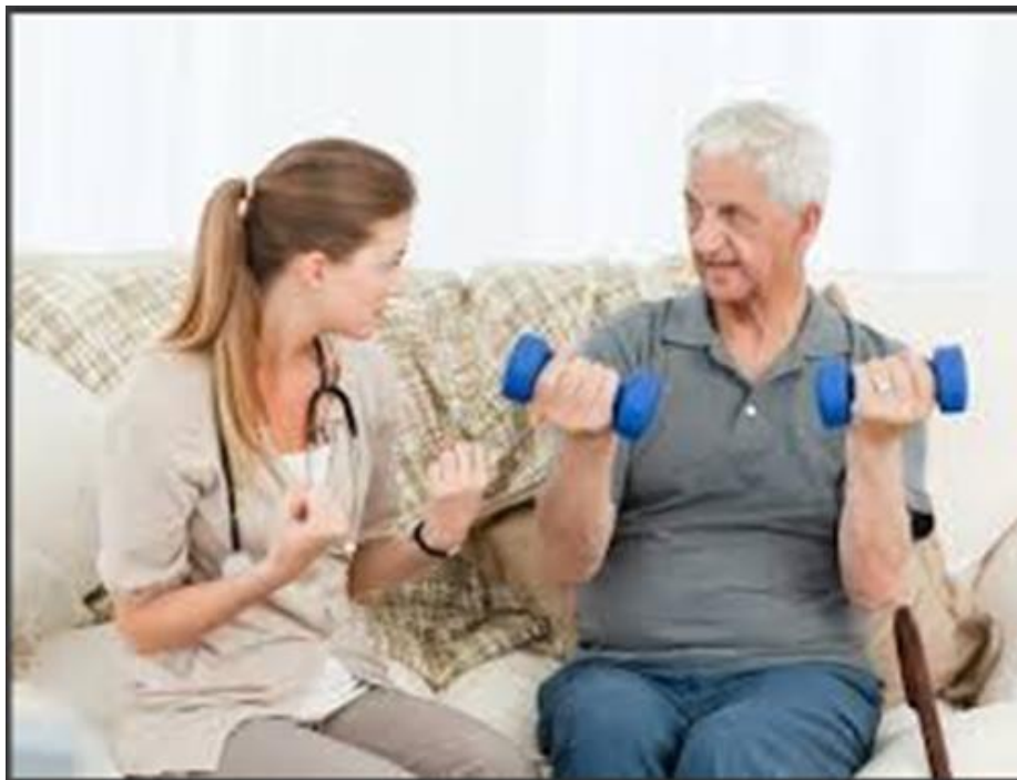
Slika 2. Edukacija i pomoć starijim osobama

Edukacija je neophodna da bismo starijim osobama omogućili povratak samopoštovanja i pomogli u povratku ili popravku kvalitete života. Starije osobe većinom imaju potrebu razumjeti svoje zdravstveno stanje, ali i pokazuju volju i želju da se nauče nositi s njime. Postoje i oni koji žele i traže uključenost treće osobe, što u velikom broju bolesti i situacija uistinu pomaže staroj osobi nositi se sa svojim stanjem. U tom slučaju to im je potrebno, ali i poželjno, omogućiti. Međutim, postoje i mnogobrojne situacije kad je uključenost treće osobe neophodna i opravdana, i to ne samo medicinski nego i pravno. Dakle, opisane su situacije regulirane ne samo etički i moralno nego i zakonski. Drugim riječima, moralno, etičko i zakonsko pravo potpune uključenosti u svoje liječenje ima i starija osoba, ako je to fizički i psihički u mogućnosti. U situaciji kad je starija osoba psihofizički zdrava, mora se poštovati volja starije osobe da informacije o njezinu zdravstvenom stanju budu tajne i uskraćene ostalim članovima obitelji. Nažalost, to pravo starije osobe često se ignorira, čime se krši osnovno ljudsko pravo takve osobe, samo zato što se radi o osobi treće životne dobi (14).