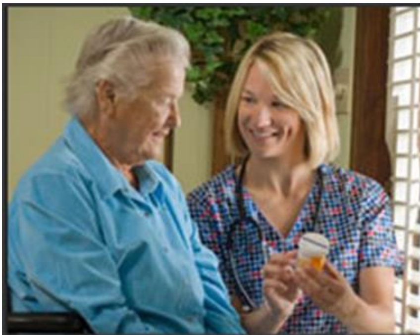
Slika 3. Pomoć starijim osobama oslabljenog sluha