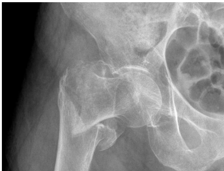
Slika 4. RTG subtrohanterični prijelom femura

Na prijemu obavljen predoperativni pregled anesteziologa. Uzet bilološki materijal za laboratorijsku analizu. Po preporuci anesteziologa, predoperativno dana terapija: Normabel tbl od 10mg.