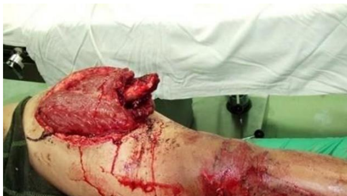
Slika 1. Otvoreni prijelom bedrene kosti