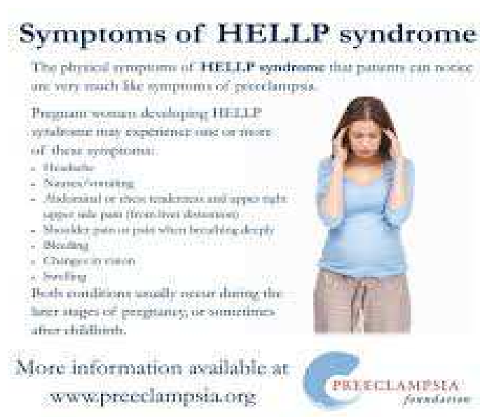
Slika1. Edukacijski plakat koji prikazuje simptome HELLP sindroma

Edukacija trudnice jedna je od uloga primalje. Potrebno je provesti informativni razgovor o periodu trudnoće u kojem se trudnica nalazi, osigurati pisanu formu edukacije u vidu brošura, letaka ili plakata u ordinaciji. Također, važno je i omogućiti trudnici dovoljno vremena i otvorena pitanja koja nam mogu ukazati na poteškoće u kojima se trudnica možda već nalazi.