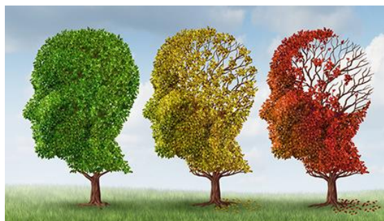
Slika 1. Simbolički prikaz propadanja moždanih struktura