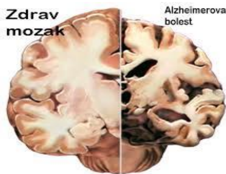
Slika 2. Prikaz mozga zdrave osobe i osobe oboljele od Alzheimerove demencije

3. Završni ili ozbiljni stadij Alzheimerove bolesti - potpuni gubitci u kratkotrajnom i dugotrajnom pamćenju, neprepoznavanje rodbine, dolazi do potpunog gubitka komunikacije, dezorijentiranost u vremenu i prostoru, potpune nemogućnosti zadovoljavanja osobnih potreba, narušeno zdravlje te povećana sklonost nastanku različitih bolesti.