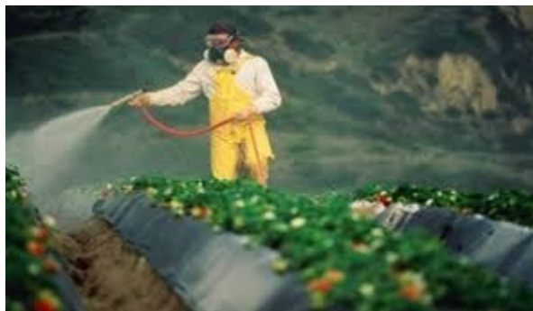
Slika 8.-Korištenje pesticida, preuzeto

s “http://saznajlako.com/2013/12/06/pesticidi-u-hrani-koje-voce-i-povrce-ima-najviše-pesticida-i-kako-se-zastiti/”