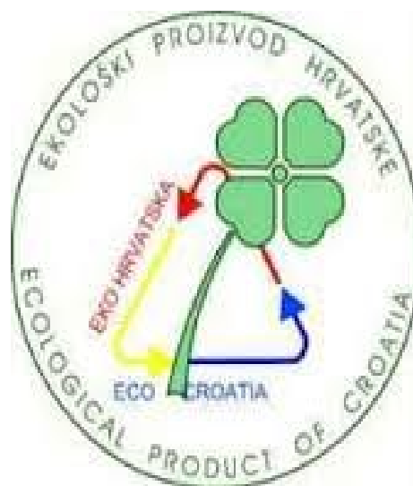
Slika 4.- Logo ekološkog proizvoda http://www.croapartments.com/site/ekoloski-uzgoj.html