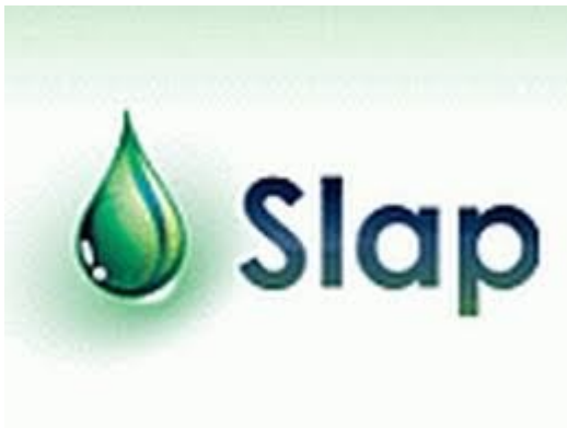
Slika 6.- Logo udruge SLAP, preuzeto s

Moduli edukacije su pripremljeni po modelima opće i specijalizirane tehnologije ekološke proizvodnje, dvodnevni seminari, besplatne konzultacije, osnove poduzetništva, marketinga i poslovnog planiranja, ekoforumi, studijska putovanja po uspješnim i razvijenim ekološkim imanjima Slavonije i Baranje te zadrugama Like i Dalmacije(14).