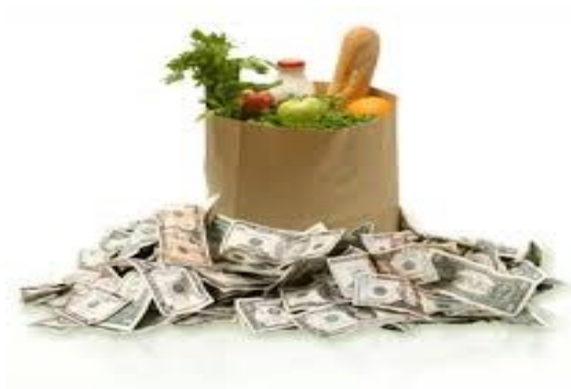
Slika 9.- Cijena eko hrane

Cijena organske hrane u odnosu na neorgansku je u Hrvatskoj između 40 i 100% viša. U svijetu je organska hrana skuplja od obične 10 do 40 %, a negdje se njezina proizvodnja i subvencionira(9).