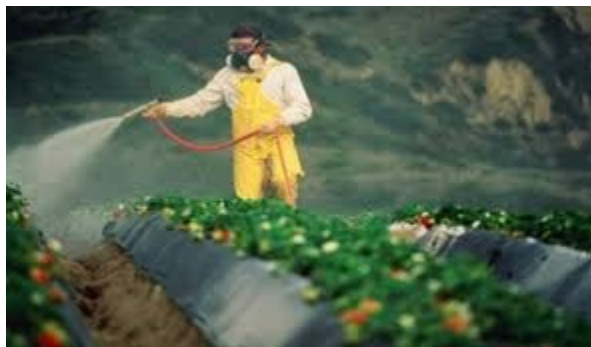
Slika 8.-Korištenje pesticida