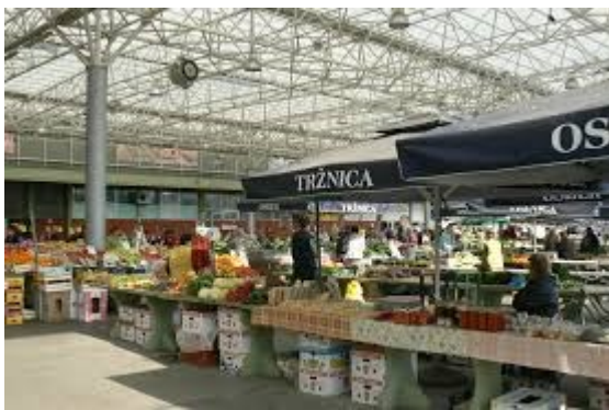
Slika 5.-zeleno tržište Osijek, preuzeto s

Zadrugari se oslanjaju na njima već poznato i uhodano tržište na osječkoj zelenoj tržnici te mnogobrojnim sajmovima diljem Hrvatske gdje imaju vrlo dobru reklamu i prodaju svojih proizvoda(14).