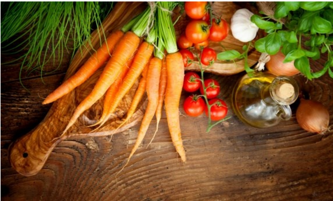
Slika 10.- Organske namirnice

Prvi hrvatski članak koji sam obradio u ovom radu na temu organska hrana je “Polovica kupaca u RH barem jednom godišnje kupi neki organski, bio ili eko proizvod”(3). U njemu se opisuje istraživanje koje se nad tisuću ispitanika provelo tijekom listopada 2013. godine te pokazuje kako 48 posto kupaca u Hrvatskoj godišnje kupi neki zdravi proizvod(3).