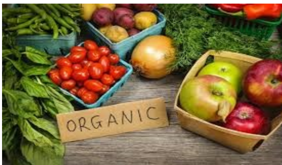
Slika 1. Organska hrana, preuzeto s " http://www.ibar.ba/tag/hrana/ "

Kako bi proizvod bio ekološki, mora biti proizveden prema propisanim pravilima, posebno deklariran, označen, pakiran i skladišten. Proizvodnja hrane visoke kvalitete, koja će pridonijeti očuvanju ljudskog zdravlja, očuvanju i zaštiti okoliša te povećanju plodnosti zemljišta, održavanje te smanjenje svih oblika onečišćenja koji mogu biti posljedica poljoprivredne proizvodnje i uzgoja životinja. Stoga kupovinom proizvoda koji nose oznaku ekološkog proizvoda potrošači indirektno utječu na zaštitu i očuvanje okoliša(11).