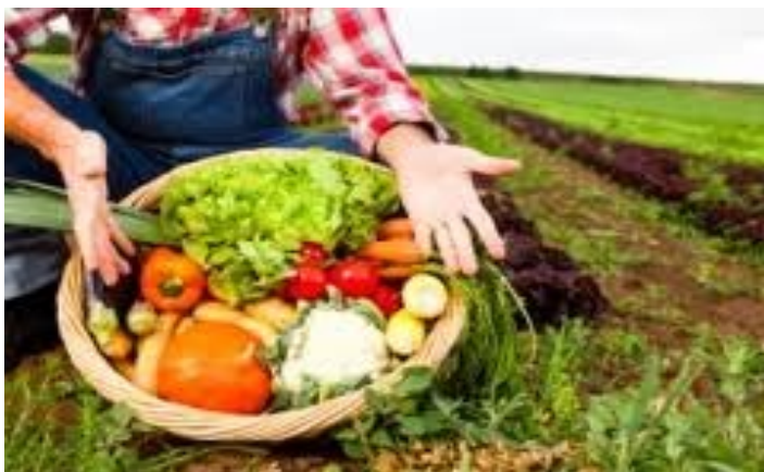
Slika 7. Vlastiti uzgoj eko hrane, preuzeto s “http://www.agroklub.com/kolumna/prijevara-no-5-proizvodnja-ekoloske-i-zdrave-hrane/5614/”

Prehrambeni suverenitet pravo je svakog naroda da utvrdi vlastiti sustav prehrane bez ugrožavanja drugih ljudi i okoliša te da očuva osnovne resurse za preživljavanje čovječanstva – plodno tlo, čistu vodu i zrak, tradicijska znanja kao i narodnu baštinu, poljoprivredne kulture. Za Hrvatsku to znači postizanje organizacije tržišta prehrambenih proizvoda na lokalnoj razini, koristeći lokalne resurse tržišta koje nije ovisno o uvozu ekološke proizvodnje široko dostupnih zdravih proizvoda te jeftinih proizvoda upitne kvalitete (8).