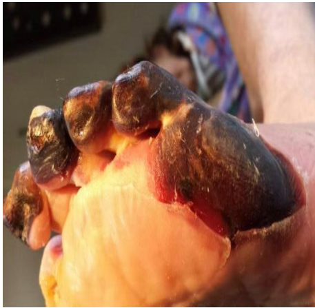
Slika 1. Suha gangrena