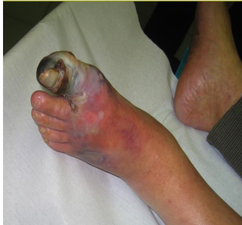
Slika 2. Vlažna gangrena