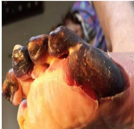
Slika 1. Suha gangrena