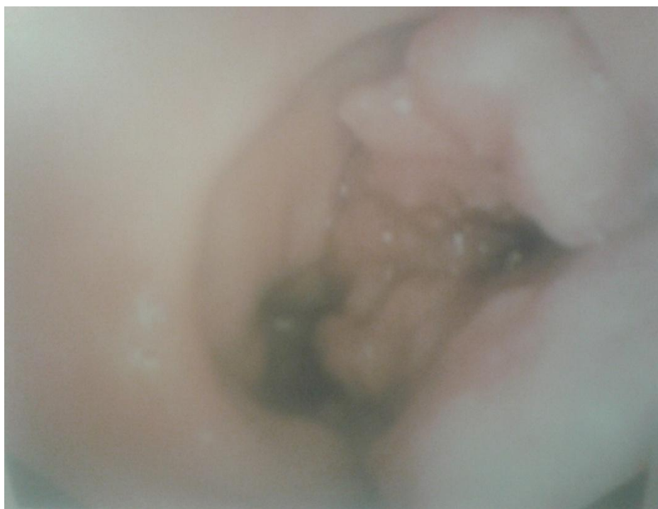
Slika 2. Karcinom želuca (endoskopski nalaz)

I unatoč svim današnjim sofisticiranim dijagnostičkim postupcima, ponekad će ipak tek laparotomija definitivno odrediti operabilnost tumora(5).