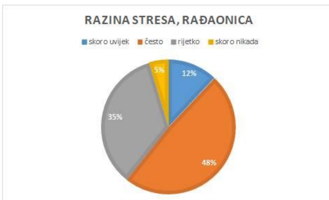
Slika 3. Prikaz razine stresa u postotcima u rađaonici

Na ove dvije slike prikazana je ukupna razina stresa na odjelu babinjača i u rađaonici u KBC-u Split.