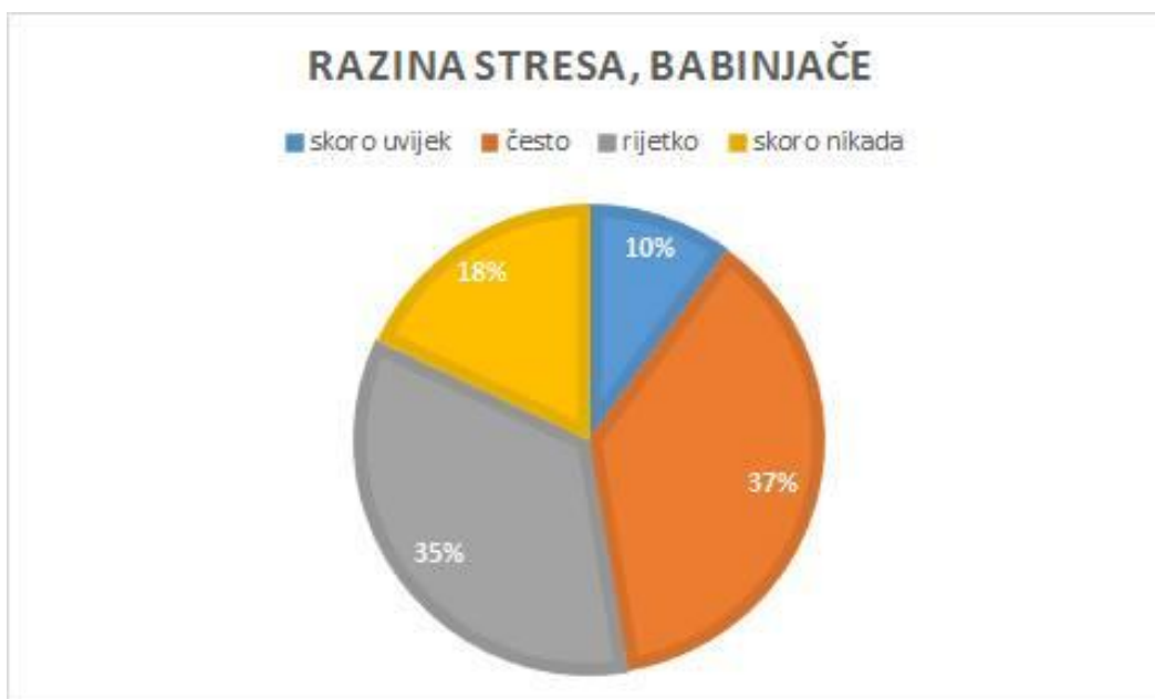
Slika 2. Prikaz razine stresa u postotcima na odjelu babinjača