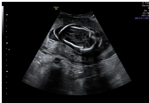
Slika 2. „Spalding sign“ na UZV